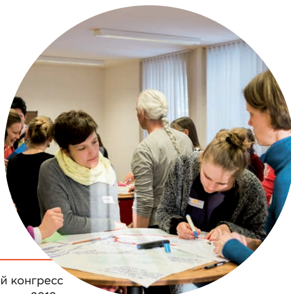
SUSTAIN, первый конгресс в Мюнхене, февраль 2019

Вместе с представителями бизнеса, власти, городской администрации и науки 8 рабочих групп, так называемых фабрик, разработали рекомендации к действию по актуальным темам ЦУР для обсуждения с жителями. В этом конгрессе приняли участие около 400 человек. В качестве продолжения проводятся ежеквартальные встречи, и в 2021 году будет проведен еще один конгресс.