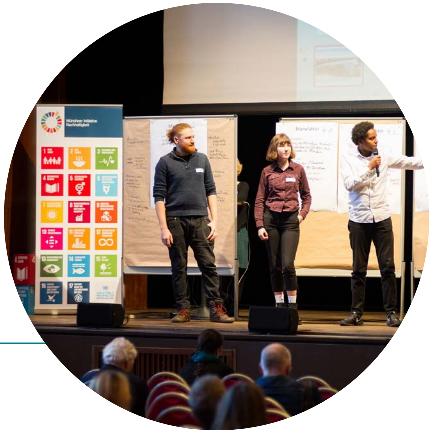
'SUSTAIN', первый конгресс в Мюнхене в феврале 2019

политическими деятелями, бизнесом, деятелями науки. Благодаря нейтральной позиции в сообществе, ФМС являются подходящей площадкой для встреч и обмена. Они также создают возможность для обычных граждан участвовать в реализации Повестки ЦУР, какой бы далекой от них она не выглядела.