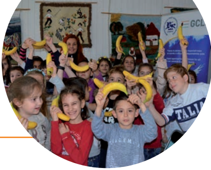
Фонд пожертвований сообщества Сливен

которые развивают местную филантропию - учреждениями, которые не только используют местные ресурсы, но и формируют социальный капитал и являются лидерами изменений. Они - основной двигатель местной филантропии и могут быть наставниками и проводниками, делиться лучшими практиками и различными методами решения социальных проблем силами местных сообществ.