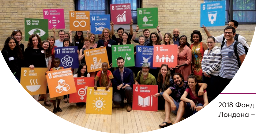
2018 Фонд местного сообщества Лондона – семинар по ЦУР

Понимая потенциал этой системы и опираясь на передовой опыт таких фондов, как Тофино, Гранд-Прери, Монреаль и Лондон (среди многих других), CFC в 2018 приняли ЦУР как основной ориентир в своей деятельности. С тех пор мы тесно сотрудничаем с фондами местных сообществ и растущей сетью партнеров по всей Канаде и в мире, чтобы создавать значимые возможности для обучения, сотрудничества и воздействия. Несколько примеров этой работы представлены ниже.