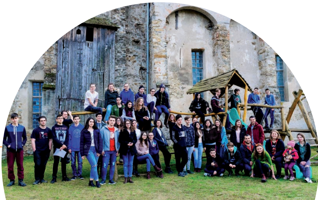
Фонд местного сообщества Фэгэраш

Чтобы стать устойчивой и эффективной, деятельность местных сообществ нуждается во внешней поддержке. Такая поддержка может быть предложена фондами местных сообществ и организациями,