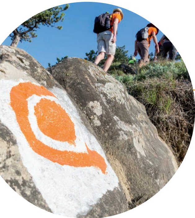
Hike Education в Одорхей, Румыния